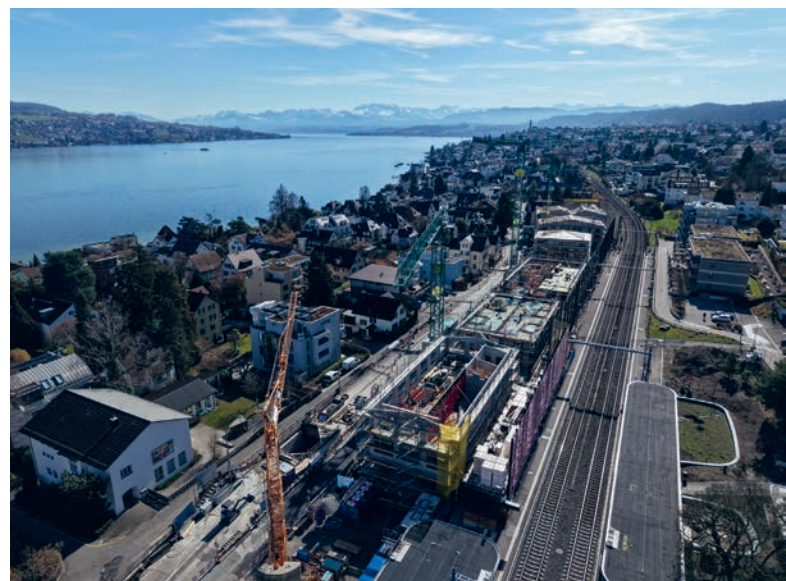
Drohnenansicht des Areals

Aufgrund der stark steigenden Anzahl an Schülerinnen und Schülern in den Gemeinden Rüschtikon und Kilchberg hat Rüschtikon zudem in Rekordzeit einen Erweiterungsbau auf dem Areal Moos erstellt: Der Trakt C für die Primarschule, die Tagesbetreuung Primarschule und die Sekundarschule wurde pünktlich fertiggestellt und konnte im Sommer 2023 der Schule übergeben werden.