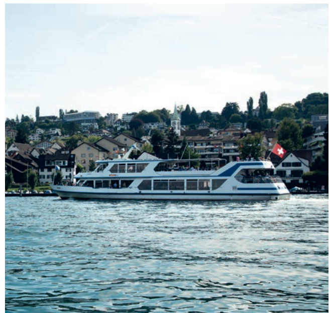
Die Finanzen von Rüslikon sind auf Kurs.

Somit hat Rüslikon seine finanzpolitischen Ziele erreicht und liegt trotz hoher Investitionen auf Kurs, wozu auch der ebenfalls erfüllte Anspruch gehört, eine Nettoverschuldung zu vermeiden.