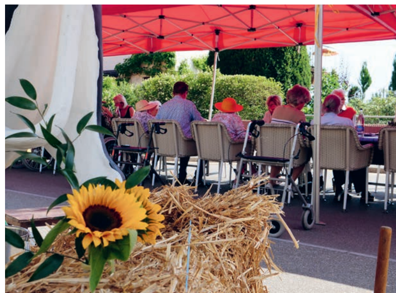
Blick in den lauschigen Garten des Abegg Huus

Pflegeheimliste einführen und hat dafür die Bezirke in «Versorgungsregionen» eingeteilt. Die zu diesem Zweck ins Leben gerufene Projektgruppe des Bezirks Horgen zeichnet sich durch eine gemeindeübergreifende konstruktive und professionelle Zusammenarbeit aus. Wie es hier weitergeht, wird sich im Laufe dieses Jahres zeigen. Die leichte Unterversorgung an stationären Pflegeplätzen im Bezirk dürfte aber in einigen Fällen dazu führen, dass Menschen oft erst ins Pflegeheim aufgenommen werden können, wenn sie schon einen mittleren Pflegebedarf aufweisen oder sogar auf andere Gemeinden ausweichen müssen. Zu guter Letzt konnten auch die Legislaturziele, die mit der Überprüfung der Strukturen und Ressourcen der Abteilung Gesellschaft und insbesondere der Fachstelle Familiencoaching zu tun hatten, erreicht und umgesetzt werden. So kann Rüschtikon die bewährte gute Dienstleistungsqualität für die Bevölkerung weiter aufrechterhalten.