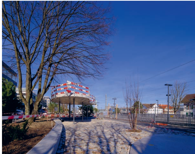
Der Pavillon beim Weingartenpark ist am Entstehen.

Weit fortgeschritten ist auch das Teilprojekt «Bahnhof Nord/Weingartenpark und -strasse». Die Hauptarbeiten, zu denen auch die Pflanzungen gehören, sind abgeschlossen. Als letzter Schritt steht der Einbau des Deckbelags auf der Strasse und den Wegen an. Dieser kann nur bei ausreichend hohen Temperaturen erfolgen. Daher sind diese Arbeiten derzeit im April 2026 vorgesehen. Die Eröffnung und Übergabe an die Bevölkerung werden voraussichtlich Anfang Mai 2026 stattfinden.