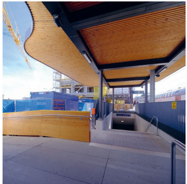
links: Eines der sechs Gebäude von «Bahnhof Süd», rechts: Perron-Ansicht (Quelle: BILDOGRAPHIE.SWISS).