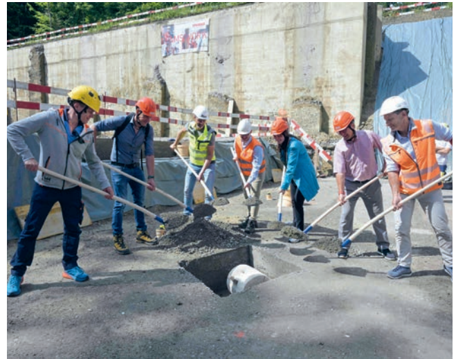
Anlässlich der symbolischen Grundsteinlegung des Wasserreservoirs «Kopfholz» wurde eine Kiste mit einem Wasserhahn darin in den Beton eingelassen.

Auch die Energieversorgung ist im Alltag nicht wegzudenken. Doch hier hat sich ein Legislaturziel anders entwickelt als geplant: Das Projekt eines Seewasserverbundes hatte zum Ziel, Seewasser zum Kühlen und Heizen von Gebäuden im unteren Dorfteil zu nutzen. Detailberechnungen zeigten jedoch, dass die Kosten für diesen Seewasserverbund im Verhältnis zum möglichen Wärmeertrag zu hoch gewesen wären. Individuelle Erdsonden erweisen sich in diesem spezifischen Perimeter als effizienter. Das Projekt wurde daher nicht weitergeführt, gab jedoch den Anstoss für eine neue, umfassende Energie- und