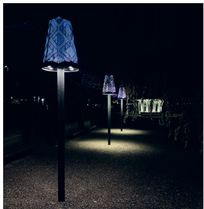
Die neuen Rüschniker Lampen verbreiten magische Stimmung am See.

Ein besonderer Lichtblick – im wahrsten Sinne des Wortes – sind die eigens für Rüschnikon entworfenen «Rüschniker Lampen». Sie wurden im Zuge der Neugestaltung der Seeliegenschaften installiert und beleuchten nachts das Seeufer. Nach über zehn Jahren Einsatz wurden sie nun technisch modernisiert – insbesondere im Hinblick auf die Reduktion von Lichtverschmutzung. Gleichzeitig sorgen sie weiterhin für ein hohes Sicherheitsempfinden und tragen zur unverwechselbaren Identität des Seeufers und bald auch beim «Bahnhof Nord» bei.