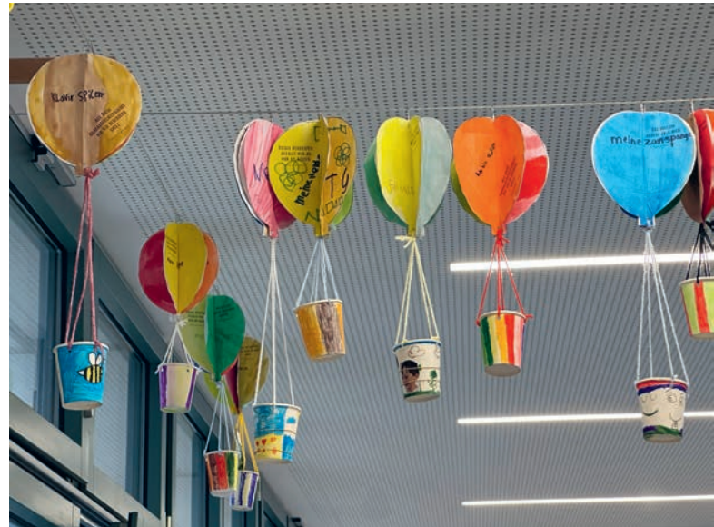
Heben ab: von Schülerinnen und Schülern gebastelte Heissluftballons

Auch die gemeindeeigene Kita ist mit 42 Kindern sehr gut ausgelastet. Die Bibliothek zählt mehrere hundert junge Nutzerinnen und Nutzer. Besonders erfreulich: dieses Angebot ist in Rüschlikon kostenlos zugänglich – ein starkes Zeichen für Chancengerechtigkeit. Ein zentrales Investitionsfeld ist die sprachliche Frühförderung. Die Schülerinnen und Schüler in Rüschlikon sprechen über 57 verschiedene Sprachen – eine grosse kulturelle Vielfalt, die zugleich fordert und bereichert. Die gezielten Investitionen in die frühe Sprachförderung zahlen sich aus und schaffen wichtige Grundlagen für den späteren Bildungserfolg.