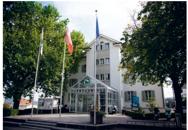
Gebäude der Gemeindeverwaltung am Pilgerweg 29

Auch sein kulturelles Erbe pflegt Rüschlikon zunehmend auf eine zeitgemässe und auch zukunftstaugliche Weise. So werden die Museumsinhalte und Kulturgüter der Gemeinde mit einer neu beschafften Inventarisierungssoftware nach und nach digital erfasst.